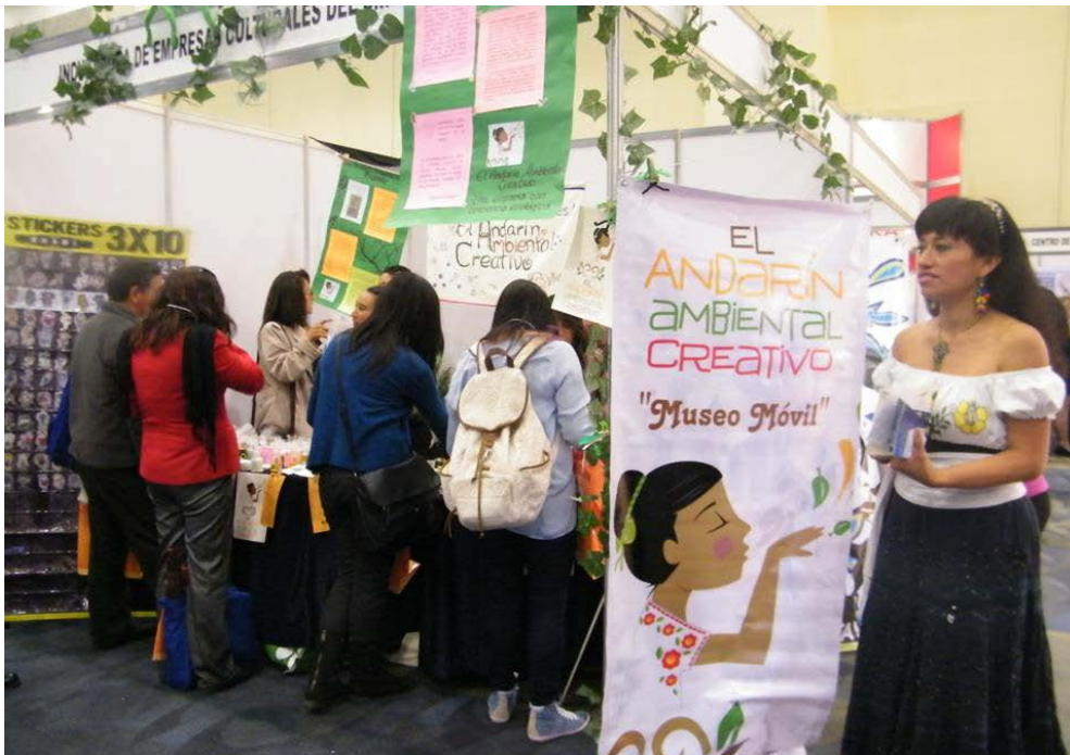
© Secrétariat à la Culture du district fédéral, sous-direction des petites entreprises culturelles, 2014

EMPLOI DURABILITÉ AUTONOMISATION STRATÉGIE CULTUREL GESTION SOCIALE ÉCONOMIQUE INDUSTRIES CRÉATIVES